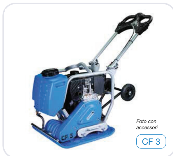
Foto con accessori