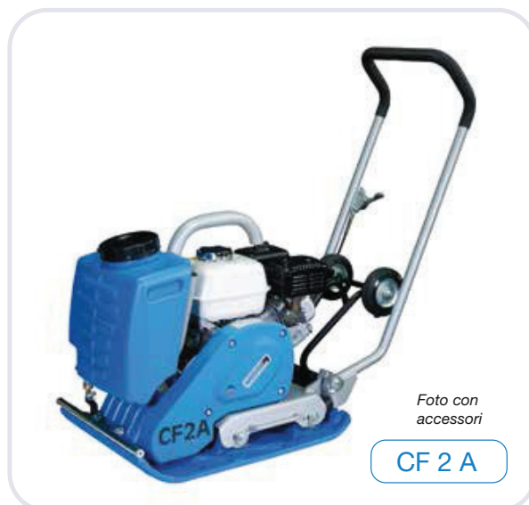
Foto con accessori