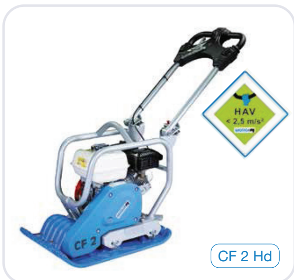
CF 2 Hd